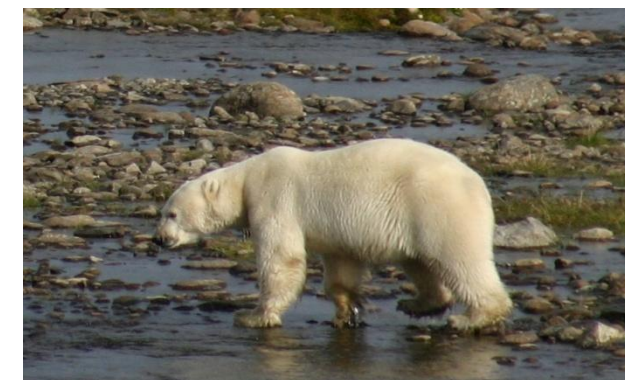
Le plus grand carnivore terrestre de la planète « l'ours polaire » peut être observé le long de la côte Est de l'Ungava ainsi qu'au Labrador.