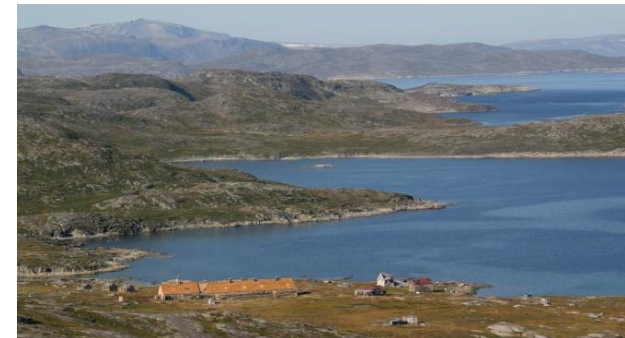
Hébron est une histoire invraisemblable.